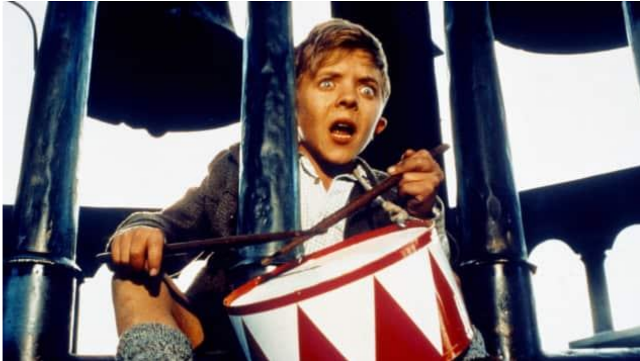
David Bennent alias „Oskar Matzerath“