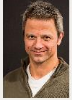
Jens Hajek Regie